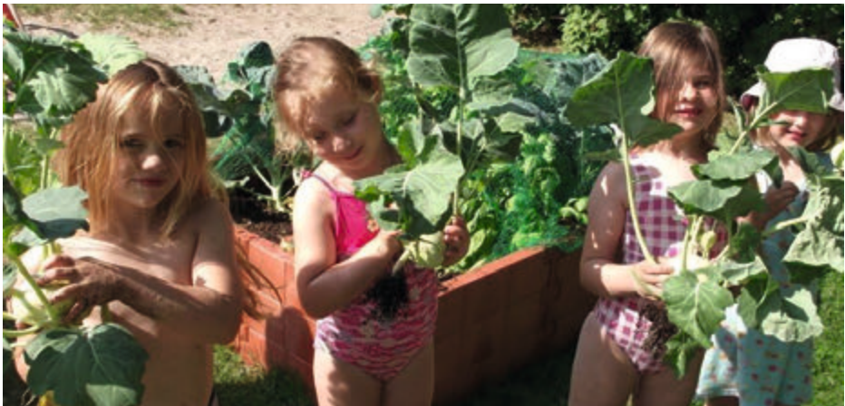
Der erste selbstgezogene Kohlrabi